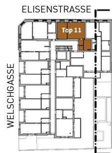
GRUNDRISS (1. OG)