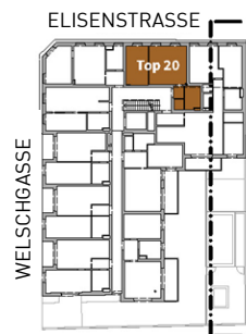
GRUNDRISS (2. OG)